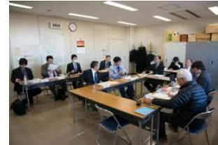
杉戸町・富岡町・川内村 地域間共助推進協議会