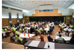
協働型災害訓練(図上訓練)

主体 市民キャビネット災害支援部会 特定非営利活動法人災害支援団体ネットワーク 国、地方公共団体との災害出動における包括的な協定の実現！