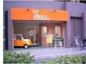
コミュニティ放送局 インターネット放送局